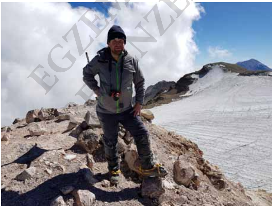
Autor na szczycie Iztaccíhuatl

O poranku 7 lutego opuściłem hotel przy głównym placu i taksówką wyruszyłem do Tlamacas. Niestety, można było dojechać jedynie do Paso de Cortés (ok. 3680 m), 25 km od Amecameca. Dalsze 5 km do Tlamacas było zamknięte. Przygotowałem się na problemy z lokalnymi służbami, dlatego czekam, kask itp. ukryłem w plecaku, ubrałem się cały na czarno. Pierwotny plan miałem taki, tego dnia dojdę do 4000 m z kawałkiem, rozbiję mój namiot kupiony za 10 dolarów w Chile, a o poranku dnia następnego stanę na szczycie Popo i wieczorem wrócę do Amecameca. Po minucie pobytu na przełęczy pomiędzy Popo a Iztaccíhuatl wiedziałem, że z moich planów nici. Kręciło się tutaj ze dwudziestu turystów i pięćdziesięciu wojskowych, policjantów federalnych i górskich. Latający helikopter wokół wulkanu. W budynku parku narodowego służby ratunkowe. Wszyscy tutaj z powodu aktywności Popocatepetl. Nazywam to odstawianiem szopki przez władze, które chcą pokazać, jak dbają o społeczeństwo. Przy takich erupcjach jak 25–26 stycznia mogą tylko sobie patrzeć, nie mają nic do roboty, a gdyby doszło