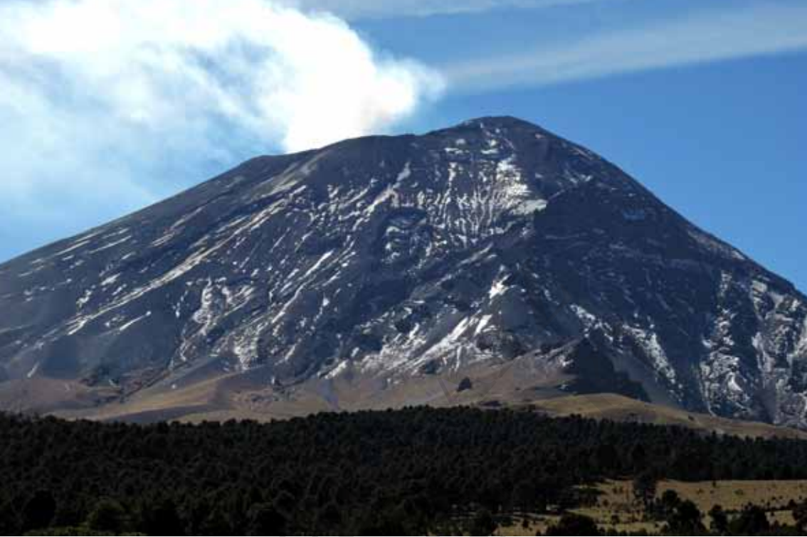
Popocatepetl z Paso de Cortés (górá) Iztaccíhuatl od strony Amecameca de Juarez (dół)