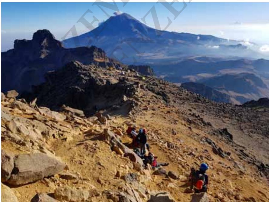
Iztaccíhuatl, w tle Popocatepetl

Drugi wariant przebiega mniej czytelną ścieżką poniżej grani (od strony miasta Amecameca) i prowadzi do schronu Refugio de Ayoloco (4680 m) pod lodowcem o tej samej nazwie. Punktem orientacyjnym jest krzyż Cruz de