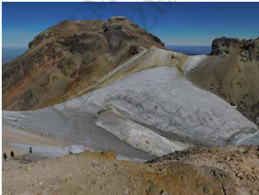
Iztaccíhuatl, lodowiec Ayoloco

Zejsście z Popocatépetl było gorsze niż wejście. Jeden z najcięższych wulkanów pod tym względem na jakim byłem. Pierwszy fragment jest tak stromy, że ledwo utrzymywałem się na nogach. Tylko na nim wywaliłem się ponad 50 razy, ale to drobiazg. Gorzej, że miałem ześlizgnięcia po 20 metrów i nie mogłem się zatrzymać. A lawa cięta ubranie i skórę jak nóż. Całe nogi i ręce pocięte, posiniaczone, krew. Ból palców u stóp, nawet trudno opisać. Okropny. Ale co nas nie zabije, to nas wzmocni, jak mówią. W dół schodziłem chyba jeszcze wolniej niż do góry. Raki by się bardzo przydały. Kolejny odcinek również dostarczył mi ponad 50 upadków, ześlizgnięć, zjazdów. Że nic sobie nie skręciłem, nie zerwałem żadnego więzadła, to bardzo dziwne, bo okazji miałem co niemiara. Drugi odcinek za mną, kilka godzin w plecy, słońce grzeje. Najchętniej bym się położył i czekał na jakiś helikopter, ale jak na złość wojskowi tego dnia nie latali. Trzeba było zejść na własnych nogach. Trzeci odcinek, trochę łagodniejszy, również dał mi popalić. Gdzieś o 17:00 dotarłem do traw i łagodniejszego zejścia. Wracałem tą samą trasą. Mało wygodną, ale z daleka od widoku z rejonu Paso de Cortés. Nikt na mnie nie czekał, nikt nie chciał mnie zwieźć choćby radiowozem do Amecameca.