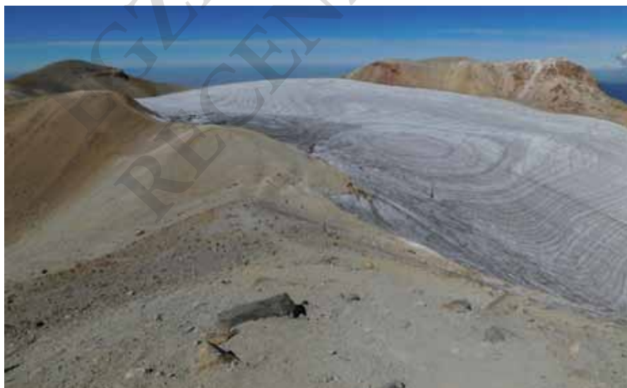
Iztaccíhuatl, lodowiec Pecho i najwyższe fragmenty wulkanu

Waluta, język – informacje są w rozdziale: Pico de Orizaba.