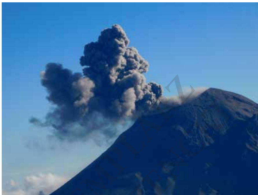
Erupcja wulkanu Popocatepetl obserwowana z Iztaccíhuatl

I był na wierzchołku Popocatepetl w 1976 roku. 40 lat przede mną. Opowiadał, o ile większy był wtedy lodowiec, niż te resztki, które ja zastałem. Wszedł z grupą Meksykanów inną drogą niż ja, z Tlamacas przez Las Cruces. Widziałem ją kiedyś na starej mapie i też planowałem wejść taką trajektorią, jednak rzeczywistość, o której pisałem, zmusiła mnie do zmiany planów i wejścia bardzo niebezpieczną, krótką drogą, w nocy i bez oświetlenia.