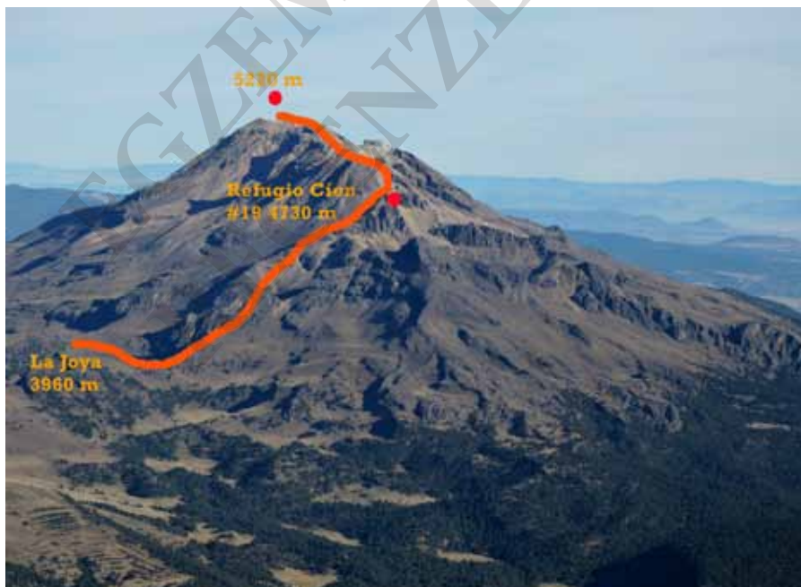
Iztaccíhuatl widziany z Popocatepetl

Iztaccíhuatl. Skoro obecnie nie można wchodzić na Popocatepetl (5424 m), bo jest to bardzo niebezpieczny wulkan, alternatywą jest niewiele niższy, znajdujący się po przeciwległej stronie Paso de Cortés – Iztaccíhuatl (5220 m), który jest wulkanem wygasłym, udostępnionym dla ruchu turystycznego. O ile ten pierwszy jest klasycznym stożkiem, drugi posiada kilkukilometryowy postrzępiony grzbiet z licznymi wierzchołkami. Najwyższe przekraczają 5000 m, najistotniejszy z nich osiąga 5220 m – wierzchołek El Pecho (tłum. pierś, piersi, klatka piersiowa). W partiach szczytowych znajdują się dwa małe lodowce (kiedyś było ich więcej). Największy w Meksyku jest na wulkanie Pico de Orizaba. Te na Izta zaczynają się na wysokości 5000 m, mniejszy położony na spłaszczeniu między wierzchołkami nazywa się Ayoloco, w zachowanym fragmencie krateru (jest w fazie zanikania), większy pomiędzy głównymi wierzchołkami w kraterze – Glaciar del Cráter (Pecho).